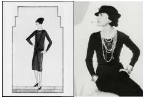
Ilustrația din revista Vogue , 1926 (stânga), cu mica rochie neagră creată de Coco Chanel (dreapta).